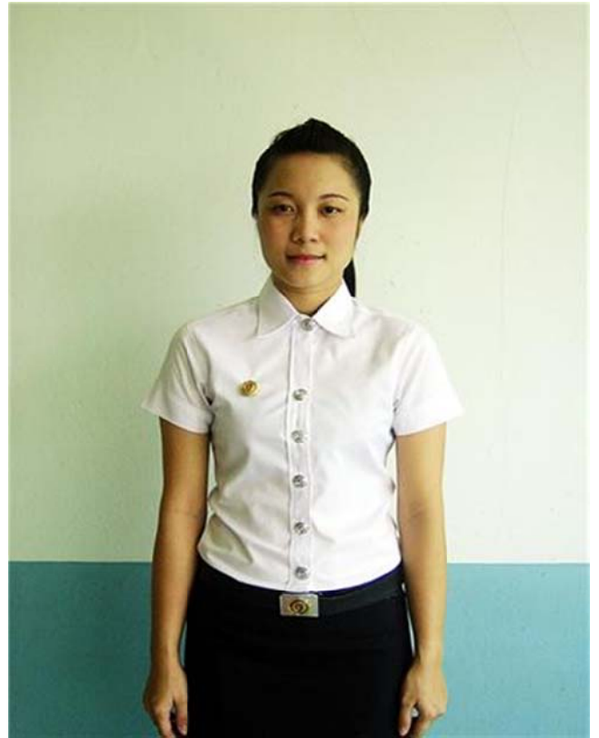
เครื่องแบบนักศึกษาหญิง