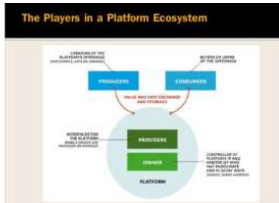
ภาพที่ 1 The Players in a Platform Ecosystem

ระบบนิเวศทางธุรกิจประกอบด้วยผู้ที่อยู่ในแต่ละขั้นตอนของวงจรธุรกิจ ได้แก่ ผู้ผลิต ผู้จัดจำหน่าย ร้านค้า และลูกค้าที่เชื่อมโยงสัมพันธ์พึ่งพาอาศัยกันเพื่อความอยู่รอดและเติบโตอย่างยั่งยืน โดยผู้ผลิต ผลิตสินค้าแล้วส่งไปยังผู้จัดจำหน่าย ผู้จัดจำหน่ายกระจายสินค้าไปยังร้านค้าปลีก ร้านค้าปลีกขายสินค้าให้กับลูกค้า ระบบนิเวศของแพลตฟอร์มประกอบไปด้วย เจ้าของแพลตฟอร์ม (Owners) ที่ควบคุมทรัพย์สินทางปัญญาและการกำกับดูแล ผู้ให้บริการ (Providers) ทำหน้าที่เชื่อมแพลตฟอร์มกับผู้ใช้ ผู้ผลิต (Producers) สร้างข้อเสนอของพวกเขา และผู้บริโภค (Consumers) ใช้ข้อเสนอเหล่านั้น ปัจจุบันที่โลกธุรกิจกลายเป็นโลกออนไลน์ ที่เชื่อมโยงกันด้วยอินเทอร์เน็ต Ecosystem ถูกใช้เป็นกลยุทธ์ธุรกิจในการสร้าง ดึงดูด รักษากลุ่มลูกค้าให้ใช้สินค้า บริการของตนตลอดไป โดยการสร้าง Ecosystem ของตนขึ้นมาพัฒนาสินค้า บริการ สิ่งแวดล้อมให้ลูกค้าพึงพอใจ เพื่อให้ลูกค้าอยู่แต่ภายใน Ecosystem ของตนเอง