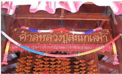
ภาพที่ 7 ศาลหลวงปู่สะแกแต้ว