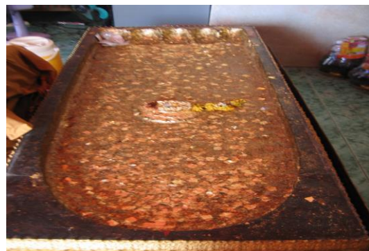
ภาพที่ 5 มณฑปรอยพระพุทธรูปท่าจำลอง