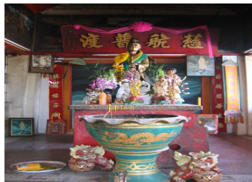
ภาพที่ 4 ศาลเจ้าอาเนี้ยวหรือศาลเจ้าแม่กวนอิม