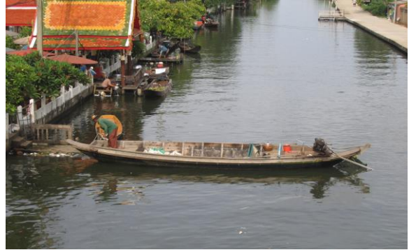
ภาพที่ 9 วิถีชีวิตดั้งเดิมของชุมชนมิให้เห็นตลอด แนวคลองภาษีเจริญ