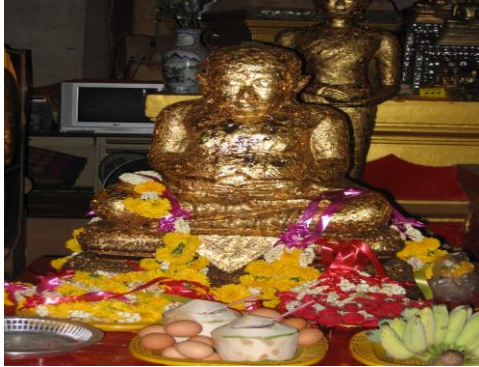
ภาพที่ 6 พระสังกัจจายน์ อายุมากกว่า 100 ปี