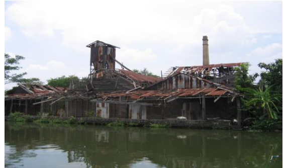
ภาพที่ 3 โรงสีไฟเหล็ก เสงหวัด ซึ่งเลิกกิจการ ไปนานแล้ว แต่ยังคงมีร่องรอยให้เห็นอยู่ริมคลองภาษีเจริญ

2.1 ร่องรอยทางประวัติศาสตร์อันยาวนานของชุมชนหนองแวม ได้มีศึกษาประวัติศาสตร์ชุมชนหนองแวมริมคลองภาษีเจริญ แขวงหนองแวม เขตหนองแวม กรุงเทพมหานคร พบว่าชุมชนหนองแวมเป็นชุมชนดั้งเดิมมีศิลปวัฒนธรรมและวิถีชีวิต ที่ควรสนับสนุนเพื่อพัฒนาให้เป็นแหล่งท่องเที่ยวเชิงวัฒนธรรม ร่องรอยทางศิลปวัฒนธรรมที่ค้นพบประกอบด้วย ภาพที่ 1-9 (อนุพงษ์ อินฟ้าแสงและดำรงพันธ์ อินฟ้าแสง, 25483)