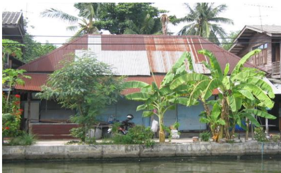
ภาพที่ 2 บ้านพักนายอำเภอคนแรกของอำเภอหนองแวมในอดีต ซึ่งตั้งอยู่ริมคลองภาษีเจริญ