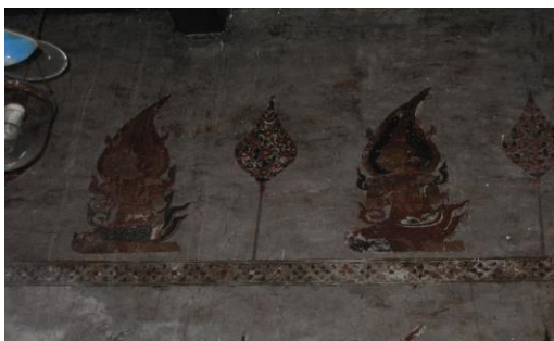
ภาพที่ 1 วิหารหลวงพ่อโตหลังเดิมซึ่งมีจิตรกรรมฝาผนังหน้าพระประธานอันทรงคุณค่า