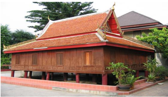
ภาพที่ 8 หอไตรกลางน้ำอายุมากกว่า 100 ปี ในวัดหนองแขม

โดยเฉพาะ พระบาทสมเด็จพระจุลจอมเกล้า เจ้าอยู่หัว รัชกาลที่ 5 ทรงพระราชดำเนนเมื่อคราวเสด็จประ พาทต้นพระอังก์ท่านได้แวะพักแรมบริเวณหน้าวัดหนอง แขม เมื่อวันที่ 15 กรกฎาคม ร.ศ. 123 (พ.ศ.2447) (สมเด็จพระ พระเจ้าบรมวงศ์เธอ กรมพระยาดำรงราชานุภาพ,2501) เรื่องราวการเสด็จประพาทต้น ด้วยคุณค่าของวัฒนธรรม ชุมชนดังกล่าวจึงควรสนับสนุนการมีส่วนร่วมของ ประชาชนเพื่อพัฒนาให้ชุมชนหนองแขมริมคลองภาษี เจริญเป็นแหล่งท่องเที่ยวเชิงวัฒนธรรมต่อไป