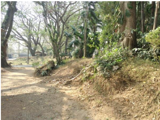
ภาพที่ 3 แนวคันดินที่เชื่อว่าเป็นกำแพงเมืองจันทบุรีในอดีต ปัจจุบันตั้งอยู่ที่ “ค่ายตากสิน” อันเป็นที่ตั้งของกองกำลังด้านจันทบุรี – ตราดและกองทัพทหารราบที่ 2

เดิมนั้นปัจจุบันเป็นสถานที่ตั้งของ “ค่ายตากสิน” เป็นที่ตั้งของกองกำลังด้านจันทบุรี – ตราดและกองทัพทหารราบที่ 2 กรมทหารราบที่ 1 กองพลนาวิกโยธิน หน่วยบัญชาการนาวิกโยธิน ลักษณะทางภูมิศาสตร์ของเมืองจันทบุรีนี้ตั้งอยู่ริมฝั่งแม่น้ำจันทบุรีที่กั้นอยู่ทางทิศตะวันตก มีแนวคันคลองเป็นปราการทางธรรมชาติทางทิศตะวันออก จารึก วิลแก้ว (2553 : 62) [3] ได้วิเคราะห์ว่าเมืองจันทบุรีมีขนาดโดยประมาณ 1,000 - 2,000 เมตร ตั้งอยู่บนเนินสูง มีคูน้ำกั้นทั้งทิศตะวันออก ทิศใต้ และทิศเหนือ ส่วนทิศตะวันตกทำการขุดคูน้ำแล้วสร้างเป็นคันดินซึ่งปัจจุบันยังคงหลงเหลือหลักฐานอยู่บ้าง ด้วยความเหมาะสมดังกล่าวข้างต้น การตีเมืองจันทบุรีของสมเด็จพระเจ้าตากสินจึงไม่ใช่เรื่องง่ายเลย อันเป็นเรื่องที่น่าศึกษาอย่างยิ่ง อย่างไรก็ตามแม้ว่าเรื่องราวจะยังคงเข้มข้นทว่าร่องรอยที่หลงเหลือกลับมีอยู่ไม่มากนัก จากการสำรวจพื้นที่จริงกลับไม่พบหลักฐานที่ชัดเจนมากนัก เช่น กำแพงเมือง ค่ายคูประตูบ แต่กลับพบเพียงแนวคันดินซึ่งก็ไม่มี ความชัดเจนแต่อย่างใด