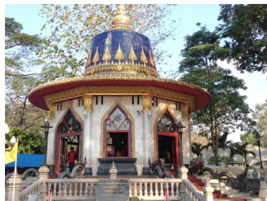
ภาพที่ 2 อนุสรณ์สถานสมเด็จพระเจ้าตากสินมหาราช ปัจจุบันตั้งอยู่ที่ “ค่ายตากสิน” อันเป็นที่ตั้งของกองกำลังด้านจันทบุรี – ตราดและกองทัพทหารราบที่ ๒

เก่าแก่ที่มีอายุไม่น้อยกว่า 400 ปี ที่เชื่อกันว่าพระยาตากทรงมาตั้งค่ายที่บริเวณนี้ วัดบ้านค่าย (ชัยชุมพล) วัดเก่าแก่ที่เชื่อกันว่าสร้างมาตั้งแต่เมื่อครั้งสุโขทัย ปัจจุบันตั้งอยู่ห่างจากเมืองระยองประมาณ 9 กิโลเมตร กล่าวกันว่าสมเด็จพระเจ้าตากสินเคยมาตั้งค่ายอยู่ที่บริเวณบ้านค่ายนี้ก่อนที่จะไปตั้งค่ายที่วัดลุ่ม ซึ่งในอดีตการตั้งค่ายในเขตชุมชน “วัด” หรือบริเวณใกล้เคียงน่าจะเป็นพื้นที่ที่เหมาะสมอย่างที่สุด ส่วนตัวเมืองระยองนั้นก็มีส่วนที่สำคัญหลายแห่งที่น่าสนใจ เช่น วัดลุ่ม (ปัจจุบันเรียก วัดลุ่มมหาชัยชุมพล) วัดเนิน วัดเก้ง ที่พงศาวดารกล่าวไว้ว่าพระองค์ได้ไปประทับและตั้งค่ายที่บริเวณวัดลุ่ม ภายหลังจากที่เจ้าเมืองระยองได้เข้าพบและพวขุนจำเมืองและกรรมการเมืองระยองได้พาทหารปืนข้ามคูน้ำจากวัดเนินเพื่อที่จะเข้าปล้นค่ายวัดลุ่ม แต่ถูกปืนยิงตกจากสะพานข้ามคูตายและทหารถูกจับได้หลายคน (จารึก วิไลแก้ว. 2553; 59) [3] ซึ่งที่วัดลุ่มนี้ปัจจุบันนี้ก็มีศาลสมเด็จพระเจ้าตากสินมหาราชที่สร้างขึ้นเมื่อ พ.ศ.2477 รวมถึงคูน้ำเก่าที่กล่าวว่าการเมืองระยองยิงปืนข้ามคูน้ำมาก็ยังคงมีร่องรอยอยู่บ้าง