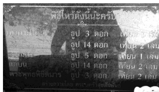
ภาพที่ 4 ข้อกำหนดหรือรายละเอียดของพิธีกรรมที่จะปฏิบัติบูชาต่อสมเด็จพระเจ้าตากสินมหาราช ณ อนุสรณ์สถานสมเด็จพระเจ้าตากสินมหาราช ค่ายตากสิน จ.จันทบุรี

คำว่า “สิ่งศักดิ์สิทธิ์” พจนานุกรมอเล็กทรอนิกส์ฉบับราชบัณฑิตยสถาน พ.ศ. 2542 [5] ได้อธิบายความหมายไว้ว่า คือ สิ่งหรือภาวะที่เชื่อว่ามีอำนาจเหนือธรรมชาติ สามารถบันดาลให้เป็นไปหรือให้สำเร็จได้ตั้งปรารถนา เช่น ขอให้สิ่งศักดิ์สิทธิ์บันดาลให้เขาหายจากโรคร้าย ในขณะที่เดียวกันก็อธิบายความหมายของคำว่า “วีรบุรุษ” ไว้เช่นกันว่าหมายถึง ชายที่ได้รับยกย่องว่ามีคุณกล้าหาญ