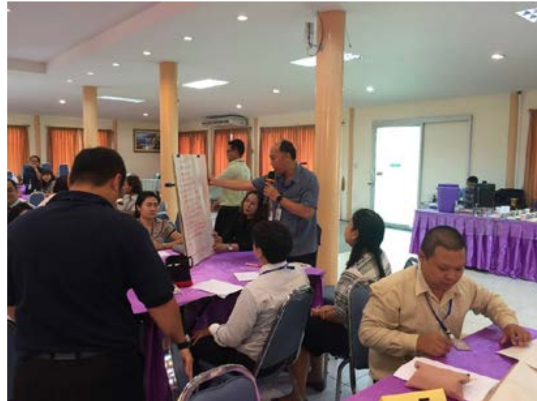
ภาพบรรยากาศการประชุมเชิงปฏิบัติการ การจัดการความรู้ (KM) เรื่องแนวปฏิบัติที่ดีของอาจารย์ที่ปรึกษา มหาวิทยาลัยธนบุรี