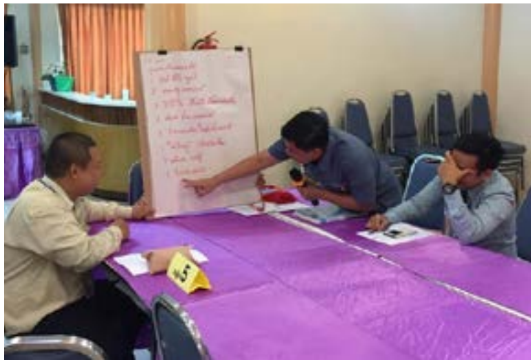
ภาพบรรยากาศการประชุมเชิงปฏิบัติการ การจัดการความรู้ (KM) เรื่องแนวปฏิบัติที่ดีของอาจารย์ที่ปรึกษา มหาวิทยาลัยธนบุรี