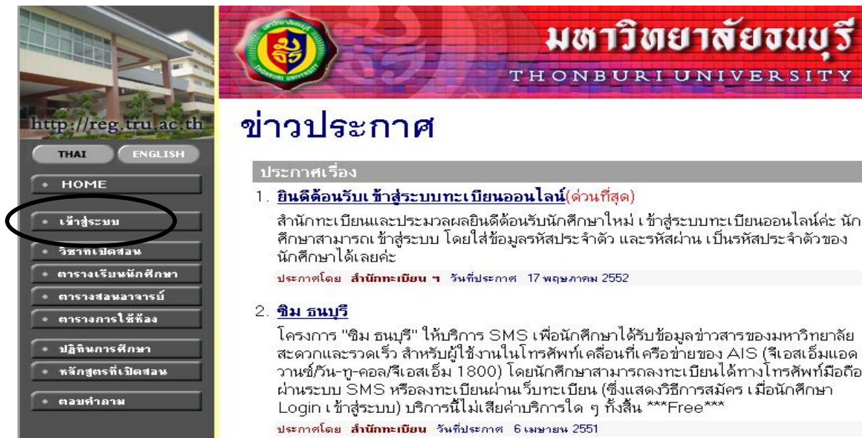
ภาพที่ 2.1 หน้าจอรุ่นเมนู เข้าสู่ระบบ เพื่อเข้าสู่ระบบประเมินการสอนอาจารย์