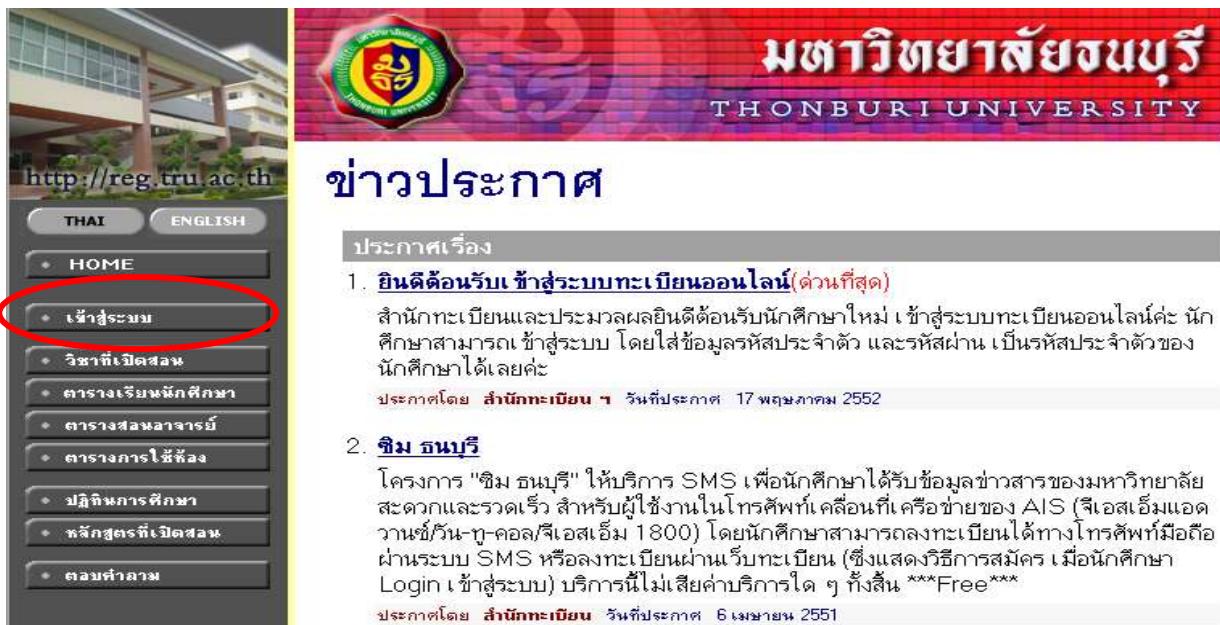
ภาพที่ 2.1 หน้าจอระบบเมนู เข้าสู่ระบบ เพื่อเข้าสู่ระบบประเมินการสอนอาจารย์