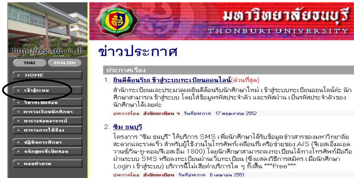
ภาพที่ 2.1 หน้าจอรุ่นเมนู เข้าสู่ระบบ เพื่อเข้าสู่ระบบประเมินการสอนอาจารย์