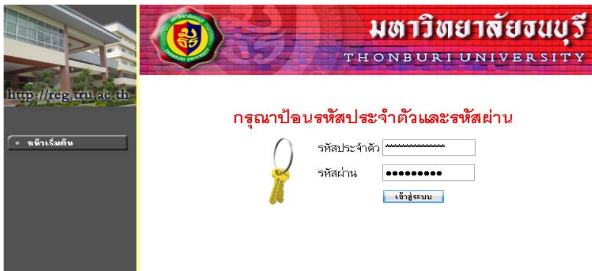
ภาพที่ 3.1 หน้าจอรุ่นเมนู รหัสผ่านประจำตัว และ รหัสผ่าน เพื่อเข้าใช้ระบบ