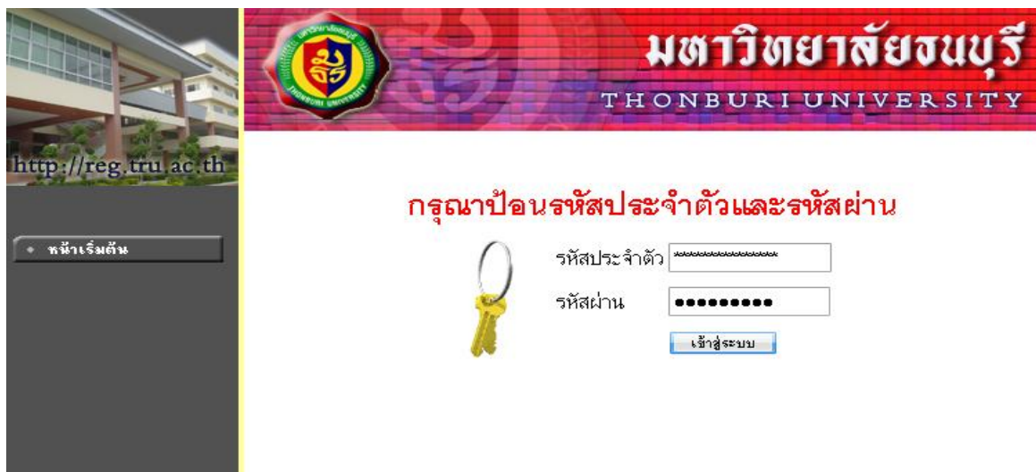
ภาพที่ 3.1 หน้าจอระบบเมนู รหัสผ่านประจำตัว และ รหัสผ่าน เพื่อเข้าใช้ระบบ