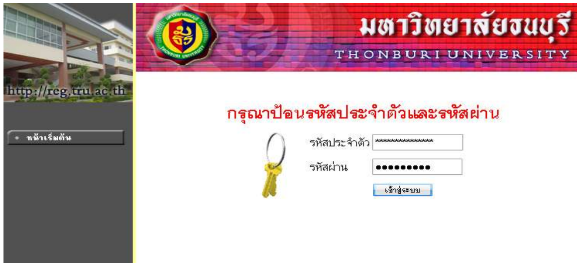
ภาพที่ 3 หน้าจอรูเมนุ รหัสผ่านประจำตัว และ รหัสผ่าน เพื่อเข้าใช้ระบบ