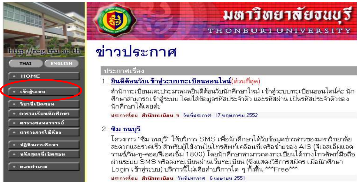
ภาพที่ 2 หน้าจอรูเมนุ เข้าสู่ระบบ เพื่อเข้าสู่ระบบประเมินการสอนอาจารย์