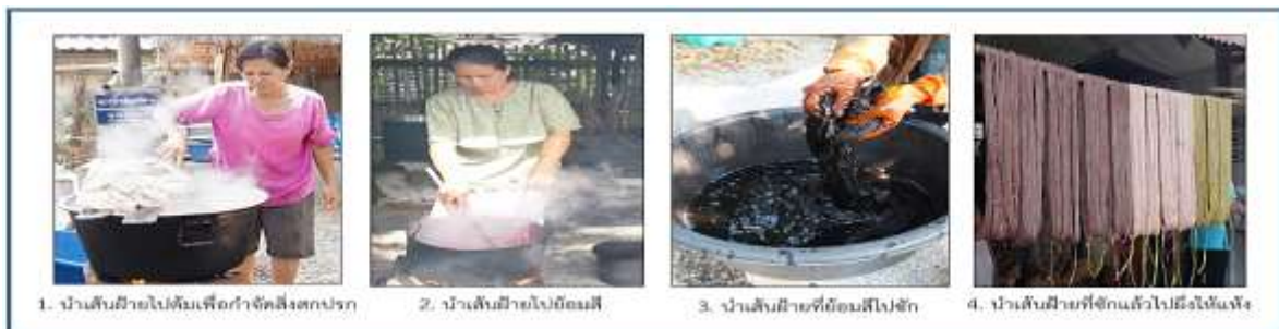
ภาพที่ 6 วิธีการย้อมผ้า

จากภาพที่ 4 และ 5 เป็นการนำเอาพืชผัก ผลไม้ที่มีอยู่ในท้องถิ่นและพื้นที่ใกล้เคียง เพื่อนำมาสกัดทำน้ำสีย้อม