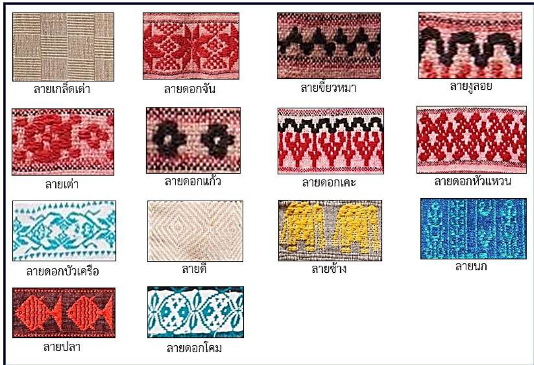
ภาพที่ 1 ลวดลายดั้งเดิม

จากภาพที่ 1 ลวดลายดั้งเดิมเป็นลวดลายที่เกิดมาจากการสังเกตสิ่งต่างๆ รอบตัว หรือภาพวาด ได้แก่ สัตว์ เช่น เต่า สุนัข งู ช้าง นก ปลา ดอกไม้ เช่น ดอกจัน ดอกแก้ว ดอกเคาะ ดอกบัวเครือ เครื่องใช้และเครื่องประดับ เช่น โคม หัวแหวน