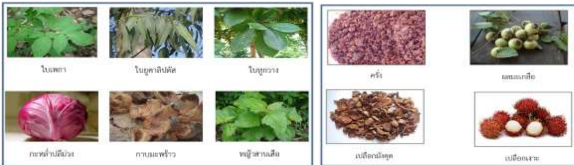
ภาพที่ 4 วัตถุดิบในท้องถิ่น ที่มา: (ศราภรณ์รัตน์และคณะ, 2559) ภาพที่ 5 วัตถุดิบต่างถิ่น ที่มา: (ศราภรณ์รัตน์และคณะ, 2559)

จากภาพที่ 3 เป็นวิธีการทอผ้าฝ้ายทอมือของบ้านหนองเจือก โดยมีจุดเด่นอยู่ที่เส้นไหมที่มีขั้นตอนการทำจากธรรมชาติซึ่งเริ่มต้นจากการเก็บดอกฝ้ายแล้วนำมาผ่านกระบวนการด้วยมือจนออกมาเป็นเส้นไหมที่สามารถนำไปทอได้