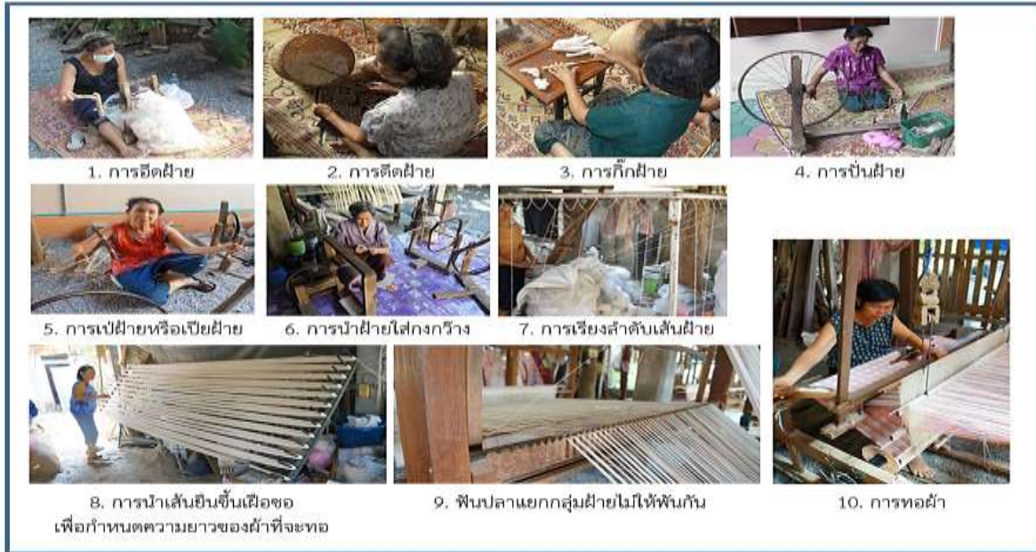
ภาพที่ 3 การทำเส้นฝ้ายและ ทอผ้าฝ้ายทอมือ ที่มา: (ศราภรณ์รัตน์และคณะ, 2559)

จากภาพที่ 3 เป็นวิธีการทอผ้าฝ้ายทอมือของบ้านหนองเจือก โดยมีจุดเด่นอยู่ที่เส้นไหมที่มีขั้นตอนการทำจากธรรมชาติซึ่งเริ่มต้นจากการเก็บดอกฝ้ายแล้วนำมาผ่านกระบวนการด้วยมือจนออกมาเป็นเส้นไหมที่สามารถนำไปทอได้